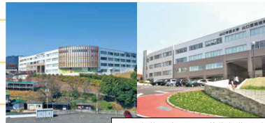
山口学芸大学 / 山口芸術短期大学